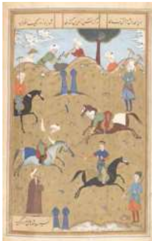
تصویر ۱- شاه و درویش در زمین چوگان، برگي از مثنوی گوی و چوگان نوشته عارفی، اواخر قرن دهم/شانزدهم، اندازه: ۱۲۳×۱۹۴ میلی‌متر، گالری هنر فریر/سکلر (شماره دسترسی: F1935.19)، واشنگتن (مأخذ: URL5). منبع: غیاثیان و افشاری، ۱۳۹۹، ص. ۶۳

چهار نگاره در مثنوی «گوی و چوگان» سروده عارفی هروی، موجود است. سه تصویر برگرفته از یکی از نسخه‌های موجود در موزه آرمیتاژ و یک تصویر از نسخه موجود در کتابخانه کاخ گلستان است. سه نگاره اول از کتاب «لوحه‌های نگارین» نوشته اشرفی (اشرفی، ۵۰) که مربوط به سال ۹۲۹ هجری قمری در دوره صفوی و مکتب تبریز است و تصویرگر آن نیز مشخص نیست. چهارمین نگاره برگرفته از نسخه موجود در کتابخانه کاخ گلستان است، این نسخه دارای دو تصویر است که متأسفانه در هیچ‌یک از این دو اثر (که البته ناتمام هم هستند) نام و مشخصات نگارگر آن ثبت نشده است. مثنوی «گوی و چوگان» که به «حالنامه» نیز مشهور است توسط عارفی در حدود سال‌های ۸۵۴ هجری قمری در ۵۰۰ بیت سروده و به فرزند شاهرخ تیموری اهدا گردیده است (فاضلی و ریاضی، ۱۳۸۹، ص. ۸۴).