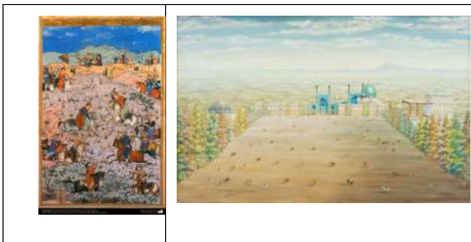
تصویر ۱۱- میدان نقش جهان اصفهان، محمدحسین مصورالملکی تصویر ۱۲- مینیاتور بازی چوگان - استاد حسین بهزاد